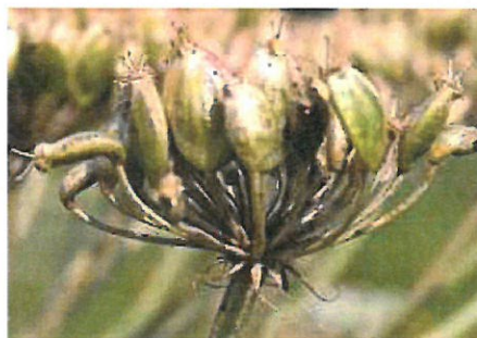
Fot. 5. Baldaszek z dojrzewającymi rozłupkami (nasionami)