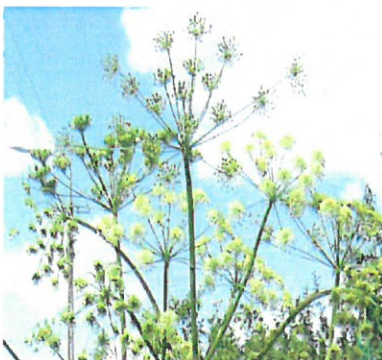
Fot. 2. Kwitnące baldachy