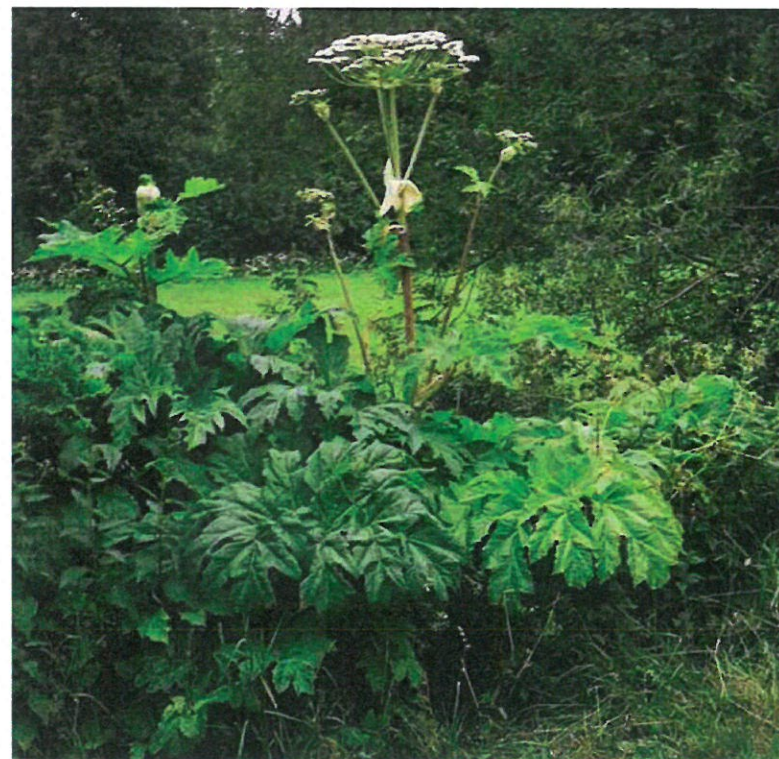
Fot. 1. Kwitnąca roślina barszczu Sosnowskiego

Ulotka nie jest przeznaczona do celów komercyjnych