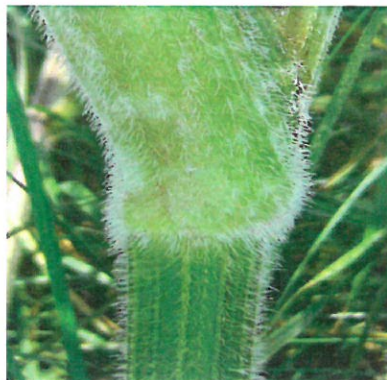
Fot. 3. Pęd pokryty włoskami