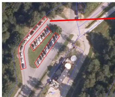
Miejsca dozwolone do parkowania

Nieruchomość położona w Polańczyku na końcu ul. Zdrojowej (po lewej stronie ulicy), na części działki Nr 94. Teren o nawierzchni utwardzonej z masy bitumicznej. Teren parkingu z odrębnym wjazdem i wyjazdem, jak również zatoczka po lewej stronie tej drogi. Brak zasilania w energię elektryczną i brak możliwości podłączenia wodociągu.