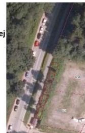
Zatoczka po lewej stronie drogi - miejsca przeznaczone do parkowania